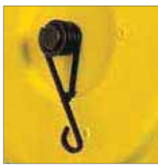
Traglasteinstellung Modell YFS-03/04/05 über zentrale Antriebswelle und Federspanne