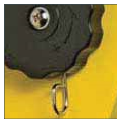
Traglasteinstellung Modell YFS-01/02 über zentralen Drehgriff und Federspanne

Druckluftgeräte, Montagewerkzeuge, Farbspritzpistolen, Nietmaschinen, Schlagschrauber, Schleif- und Poliermaschinen etc.